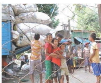
ゴミ収集場の少年たち