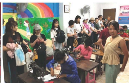
ミシンによる縫製技能の習得で 貧困からの脱出をめざす